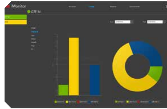
Estados de funcionamento da máquina: tempos totais em um período definido pelo usuário

Os dados de uma única máquina podem ser visualizados diretamente na tela do CNC, enquanto num ou mais computadores externos na fábrica podem ser recolhidos e visualizados os dados de todas as máquinas conectadas.